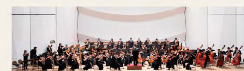
管弦楽 東京ユニバーサル・フィルハーモニー管弦楽団