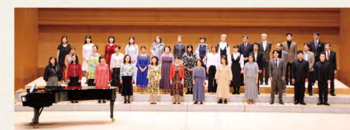
合唱 TOKYO OTA OPERAコーラス